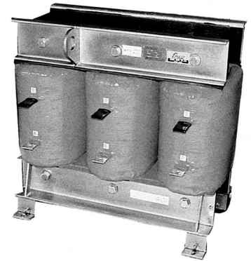
AT-318K 3300V 1800kW

絶縁強度 3300V LI45kV AC16kV 6600V LI60kV AC22kV(※6600Vの場合、形式が1ランク大きくなります)